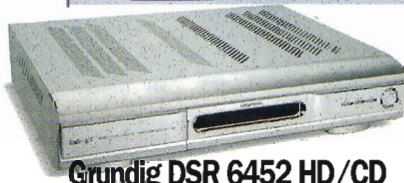
Grundig DSR 6452 HD/CD

Grundig on peräisin samalta tehtaalta kuin Handan. Vertailun ainoana laitteena Grundigissa on myös satelliittiviritin.