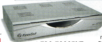
Finnsat FSC 7200PVR

Valikoiden grafiikka on selkeää ja teksti on helppolukuista. Ääni kuuluu ja kuva näkyy valikoiden päätasoilla, mutta ei valikkorakenteen muissa osissa. Valikoiden teksti on pääosin kunnossa, siinä on vain vähäisiä kielioppikukkasia.