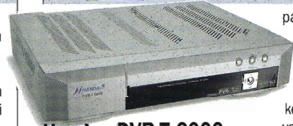
Handan DVB-T 6000

Handanin valikot ovat selkeät, grafiikka on näyttävää ja värit hyvin valittu. Tämänkin laitteen valikoissa on kirjoitusvirheitä, ja muutama ilmoitus on jäänyt suomentamatta. Valikkoja käytettäessä ei näy kuvaa eikä kuulu ääntä.