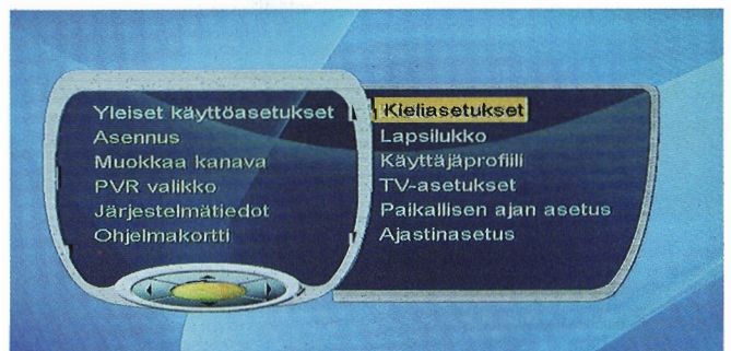
Handanin valikot ovat selkeitä ja helpottajaisia. Handanin, kuten muidenkin laitteiden käyttöliittymään on jäänyt selkeitä kielloppivirheitä.

Yhdenkään laitteen käyttöpasta ei voi kehua erinomaiseksi. Niistä selviää suomen kielellä toimintojen käyttö, mutta ongelmien ilmetessä niistä ei juuri ole apua. Vertailun laitteiden oppaat ovat keskimäärin parempia kuin edullisten, ilman