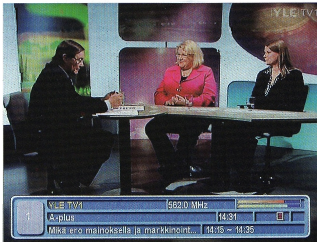
Topfieldin ohjelmaopas on hyvä esimerkki selkeästä ohjelmaoppaasta. Kirjaimet ovat isokokoisia, värit ovat hyvin valittu eikä tekstiä ole näytöllä liikaa.

Jotta digivastaanotinten tarjoama useiden kymmenien tuntien viihdevarasto tulisi hyö-